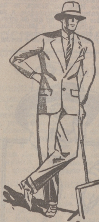
Trojes de paño, confección fina, de 50, 60, 70, 80, 100 y 125 ptas.

Plaza Mayor 42 y Lala Calvo, 9 Sucursal: Plaza Mayor, 5 BURGOS Primera casa en confecciones para caballero, señora, jóvenes y niños. — Tejidos, Pañería y Sastrería.