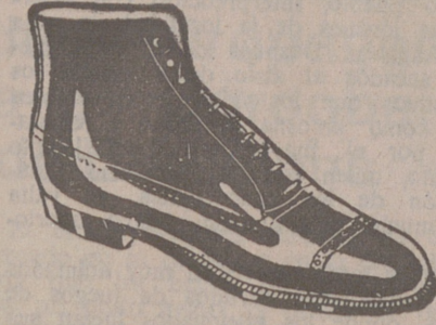
Botas en negro o color, a 19'50.-Piel d hierro, 19'50.-Piso goma, 18'00.-Fuerte campo, 16'75.