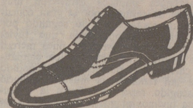
Zapatos todos los números, a 18 pesetas.-Charol, a 19'50.-Cosido todo.