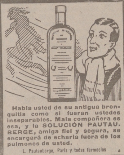
Habla usted de su antigua bronquitis como si fueran ustedes inseparables. Mala compañía es esa, y la SOLUCIÓN PAUTAU. BERGE, amigo fiel y seguro, se encargará de echarla fuera de sus pulmones de usted. L. Pautau, París y todas farmacias