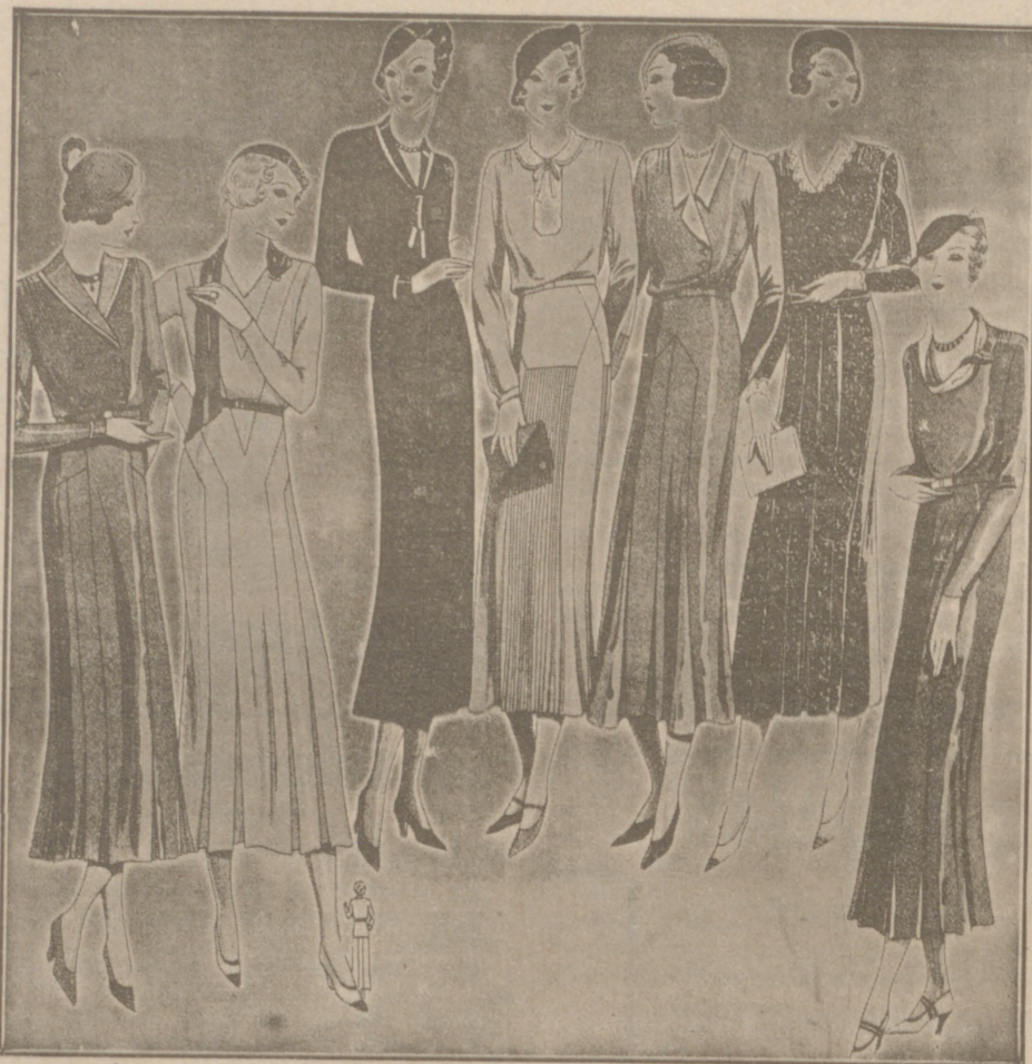
Vestidos de crespón y lana, modelos novedad, de 25, 30, 40, 50 y 60 pesetas.

Casa Manguía :: Plaza Mayor, 42 y Lala Calvo 9 Sucursal: Plaza Mayor, 5 BURGOS Primera casa en confecciones para caballero, señora, jóvenes y niños. — Tejidos, Pañería y Sastrería.