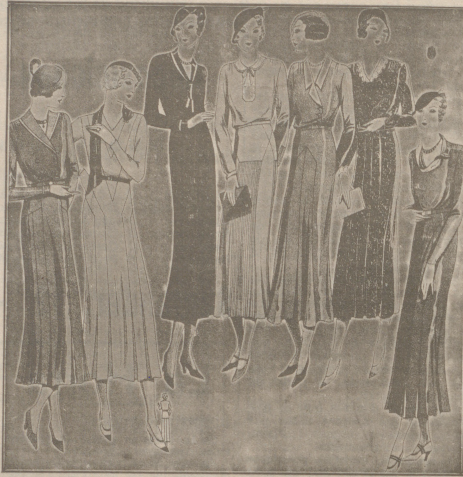
Vestidos de crepón y lana, modelos novedad, de 25, 50, 40, 80 y 60 pesetas.

Casa Munguía : Plaza Mayor, 42 y Lala Calvo 9 Sucursal: Plaza Mayor, 5 BURGOS Primera casa en confecciones para caballero, señora, jóvenes y niños. — Tejidos, Pañería y Sastrería.