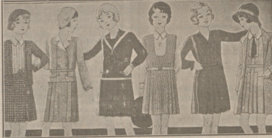
Vestiditos de lana, crepón seda y punto lana, edad de 8 a 14 años, a 14, 16, 18, 20 y 25 pesetas.

Casa Munguía :: Plaza Mayor, 42 y Lain Calvo 9 Sucursal: Plaza Mayor, 5 BURGOS Primera casa en confecciones para caballero, señora, jóvenes y niños. — Tejidos, Pañería y Sastrería.