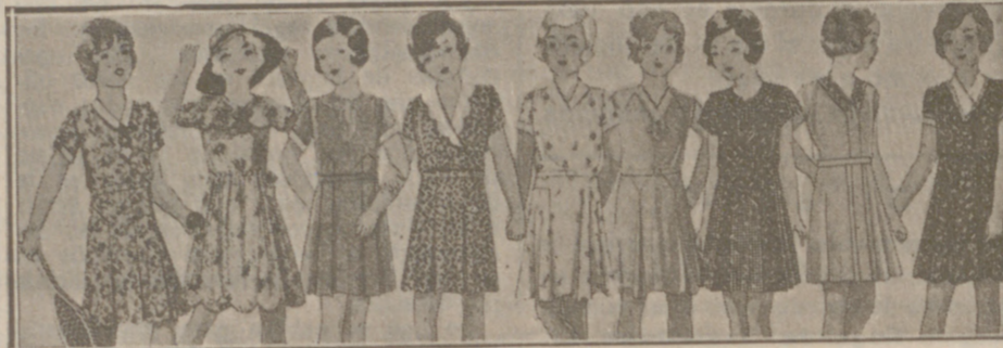
Vestiditos niñas edad de 5 a 10 años, en lana, crepón o punto a 10, 12, 15, 16, 18 y 20 pesetas.

La experiencia demuestra que los chocolates y dulces de MATIAS LOPEZ SON LOS MEJORES DEL MUNDO Pedidos en todos los ultramarinos y confiterías