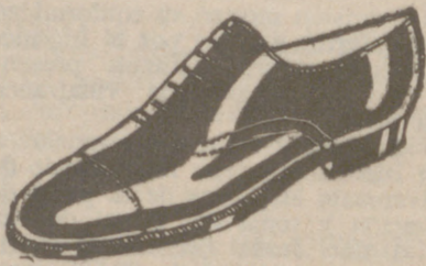
Zapatos todos los números, a 18 pesetas.—Charol, a 19'50.—Cosido todo.