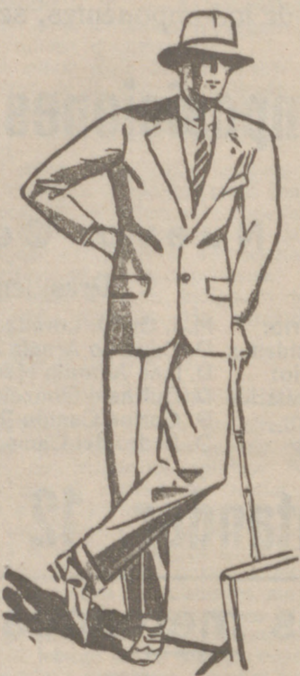
Trejes de paño, confección fina, de 50, 60, 70, 80, 100 y 125 ptas.