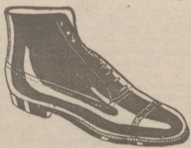
Botas en negro o color, a 19'80.-Piel de hierro, 19'80.-Piso goma, 18'00.-Fuerte campo, 16'75.