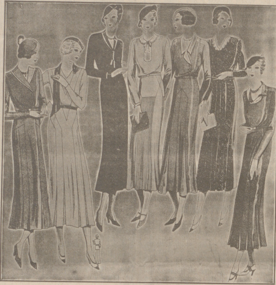
Vestidos de crespón y lana, modelos novedad, de 25, 50, 40, 80 y 60 pesetas.

Casa Manguía Plaza Mayor, 42 y Laín Calvo, 9 Sucursal: Plaza Mayor, 5 BURGOS Primera casa en confecciones para caballero, señora, jóvenes y niños. — Tejidos, Pañería y Sastrería.