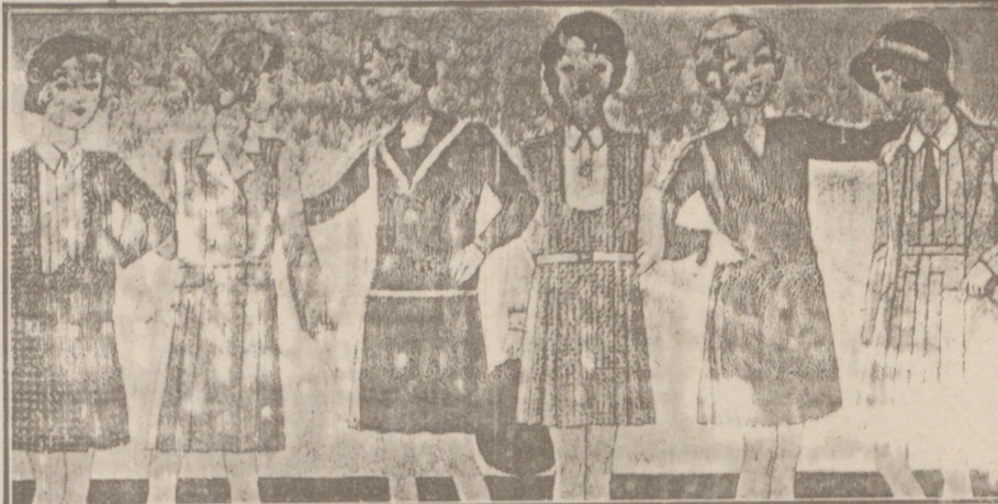
Vestiditos de lana, crespón seda y punto lana, edad de 8 a 14 años, a 14, 16, 18, 20 y 25 pesetas.

Primera casa en confecciones para caballero, señora y niños.