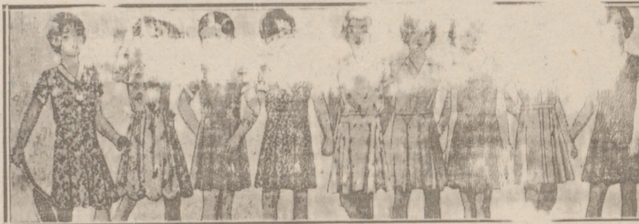
Vestiditos niñas edad de 5 a 10 años, en lana, crespón o punto a 10, 12, 15, 16, 18 y 25 pesetas.