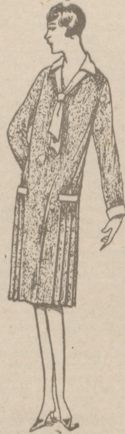
Batas PERCAL. SATÉN NEGRO o CEFIRO desde 7 a 15 pesetas. MODELOS BONITOS

USTED CONSEGUIRA TOMAR UN BUEN CAFE PIDIENDO EL DE ESTA MARCA: