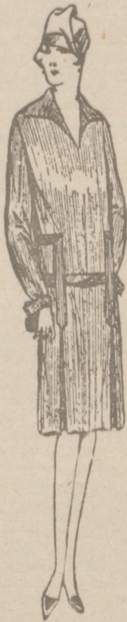
Vestidos de CRESPON o LANA de 18 a 55 pesetas. CORTE MODERNO

Gran Casa de Tejidos y Ropas hechas para Caballero Señora y Niños