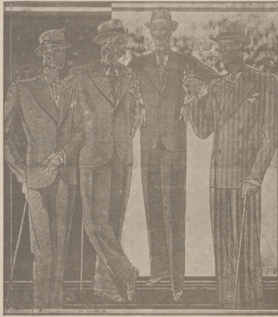
Trajes paño novedad desde 40 a 150 pesetas. — Corte moderno.

JESÚS DE GRADO VILLADIEGO (Burgos) Se construye y arregla toda clase de aparatos ortopédicos. Últimos modelos en piernas y brazos artificiales. Aparatos para corregir piernas y pies torcidos. Corsés ortopédicos para el mal de Pott y derivaciones de la columna vertebral. Planillas para pies planos. Toda clase de fajas contra la obesidad, riñón flotante, descenso de estómago, eventraciones y medicinas para cada caso. APARATOS HERNIARIOS, SISTEMA «TALISMAN», construidos especialmente para cada caso, garantizando la absoluta contención de la hernia. PRECIOS ECONÓMICOS EN BURGOS estará dicho especialista el día primero y el 15 de cada mes, en el HOTEL UNIVERSAL, desde las diez de la mañana hasta las cuatro de la tarde, donde facilitará gratuitamente y con sumo gusto toda clase de consultas y explicaciones que se le pidan. No confundirse! El día primero y el 15 de cada mes, en el HOTEL UNIVERSAL