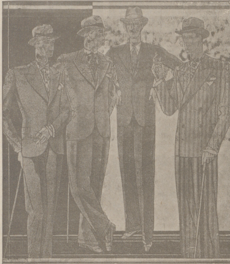
Trajes paño novedad desde 40 a 150 pesetas. — Corte moderno.

La experiencia demuestra que los chocolates y dulces de