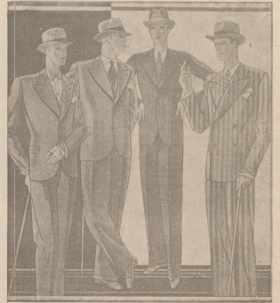
Trojes paño novedad desde 40 a 150 pesetas. — Corte moderno.