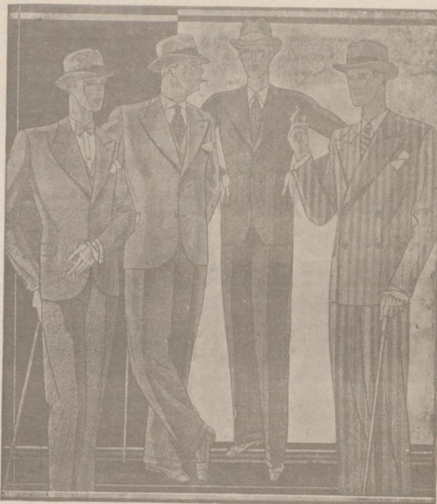
Trajes paño novedad desde 40 a 150 pesetas. — Corte moderno.

Casa Munguía Plaza Mayor, 42 Lain-Calvo, 9 y 11 BURGOS