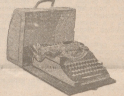
Máquinas de escribir