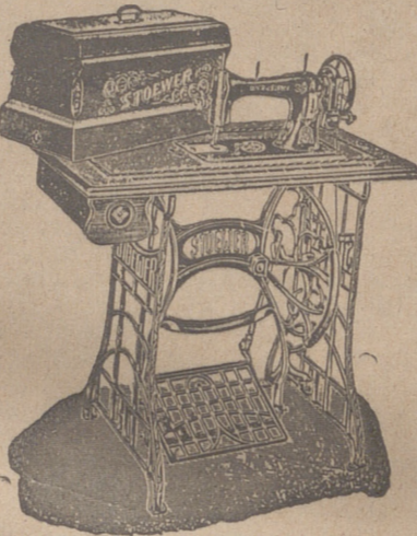
Máquinas de coser

PLAZA MAYOR, 42 LAIN CALVO 9 Y 11 BURGOS