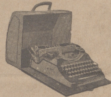
Máquinas de escribir

Doméstica para coser y bordar a precios antiguos, de 540 ptas. Alemanas.