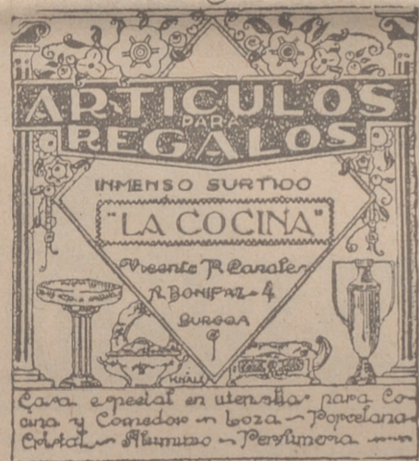
LA COCINA. Presente a la venta en la tienda de la casa de la libertad...