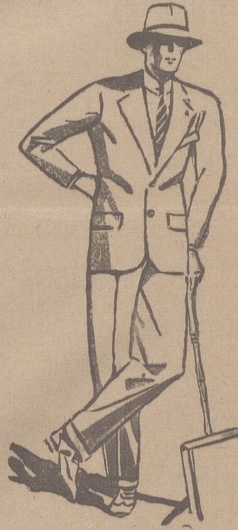
TRAJES DE PANO. CORTE MODERNO de 45 a 150 pesetas