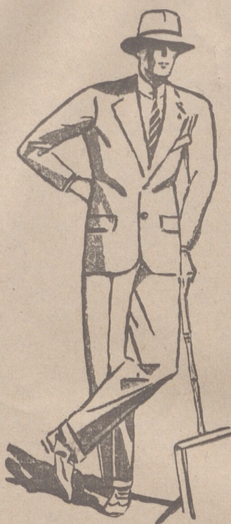
TRAJES DE PANO, CORTE MODERNO de 45 a 180 pesetas

PLAZA MAYOR, 42 LAIN CALVO 9 Y 11 BURGOS