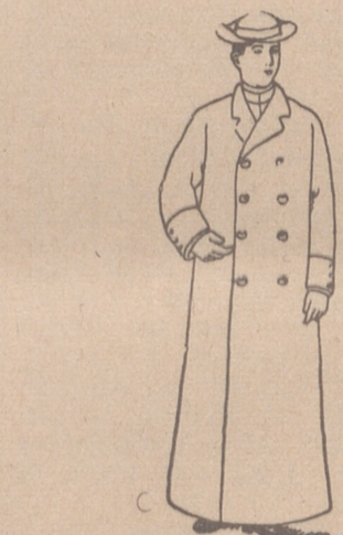
Guardapolvos en safín, gabardina o dril, de 16 a 26 pesetas.