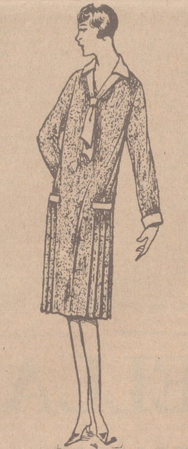
Vestidos de crepón, seda y en lana, colores novedad, a 20, 25, 30 y 40 ptas