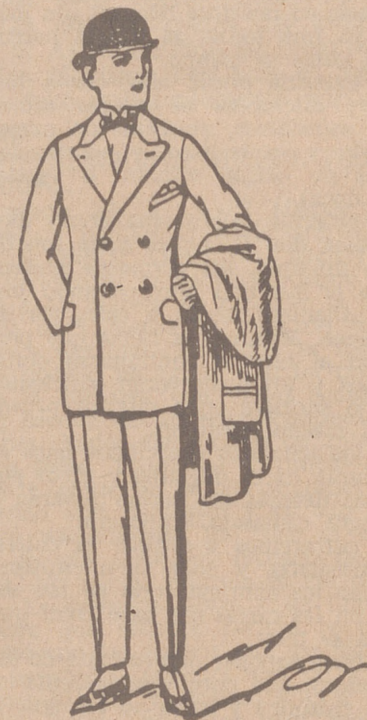
TRAJES DE PAÑO, CORTE MODERNO de 45 a 160 pesetas

PLAZA MAYOR, 42 LAIN CALVO 9 Y 11 BURGOS