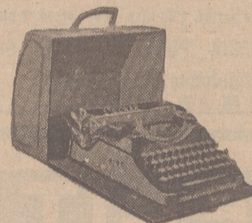
Máquinas de escribir

Doméstica para coser y bordar a precios antiguos, de 540 ptas. Alemanas.