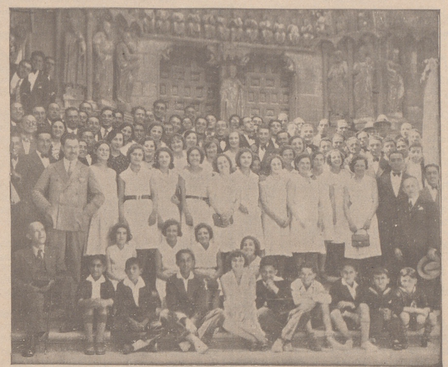
La Coral de Torrelavega