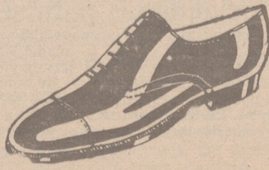
Zapatos en cinco colores distintos a 18 pesetas Zapato Charol, a 19'50