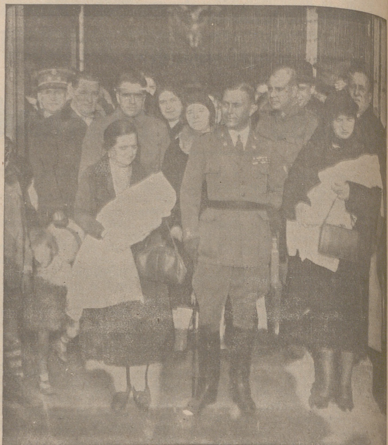
El general Villabrilie con las dos madrinas.

Ayer tarde a las tres y media se ha celebrado con toda solemnidad en la Capilla de la Purísima Concepción, de la barriada de Casas Militares, el bautizo de una niña y un niño, los primeros que han venido al mundo en dicha barriada.