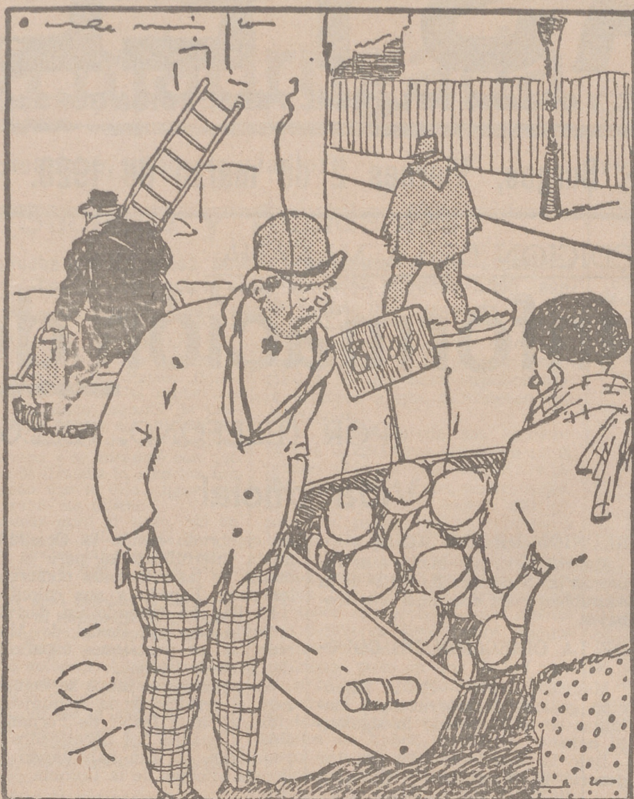
LA VIDA CARA

—¡Qué barbaridad! ¡Vaya unos precios que tienen las patatas! ¿No haría usted una rebaja a un colega? —También es V. comerciante? —No, señora; soy estafador.