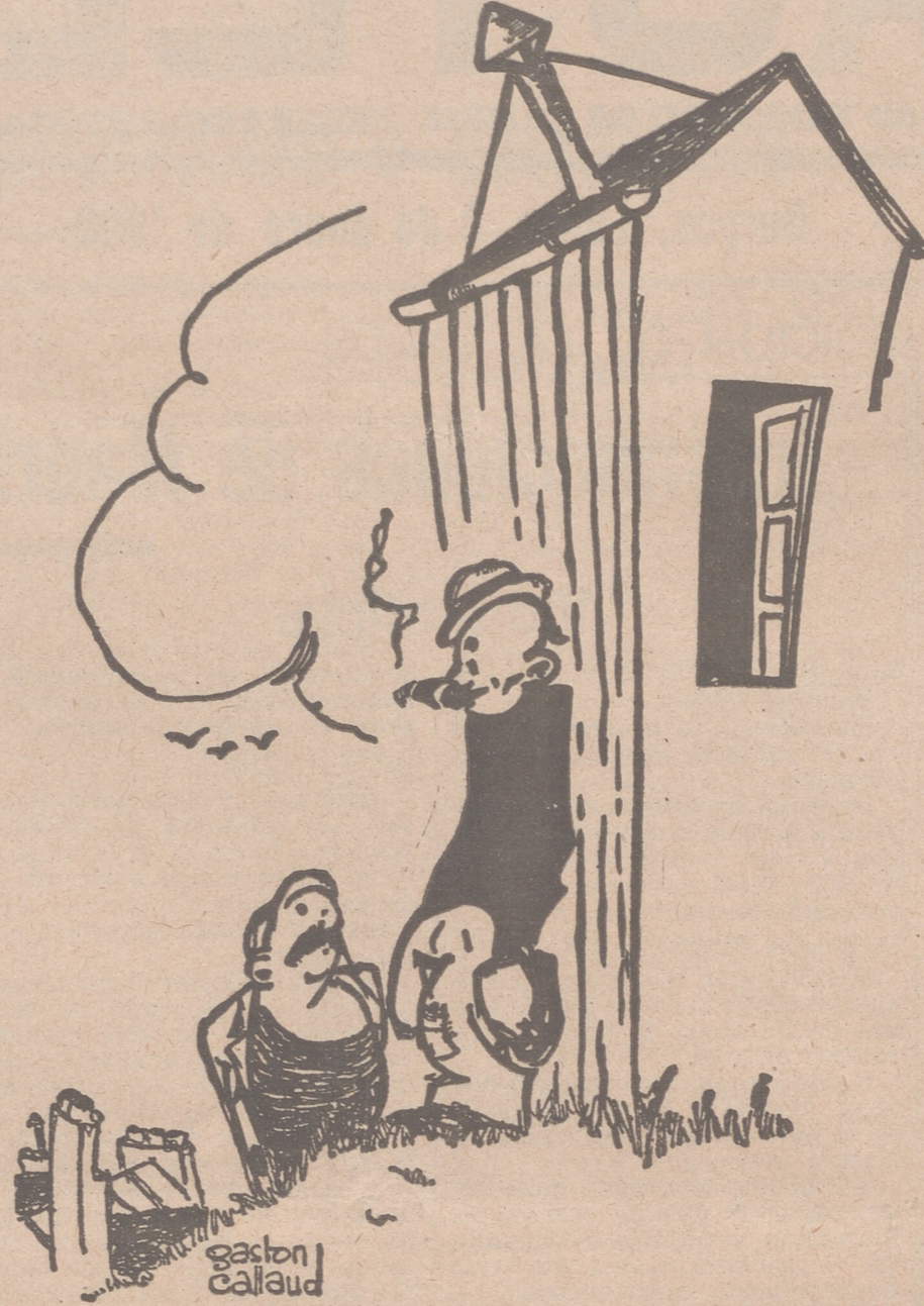
LA ESPERANZA 'DEL' RADIOESCUCHA

EL DESHOLLINADOR. —¿Qué hace V. ahí tantas horas de viga derecha? ¿A ver si llega la onda? EL RADIOESCUCHA. —¡Quita, hombre! Estoy esperando a ver si viene otro huracán y vuelve a tirar aquella maldita antena, para poder oír otros cuantos días tranquilo.