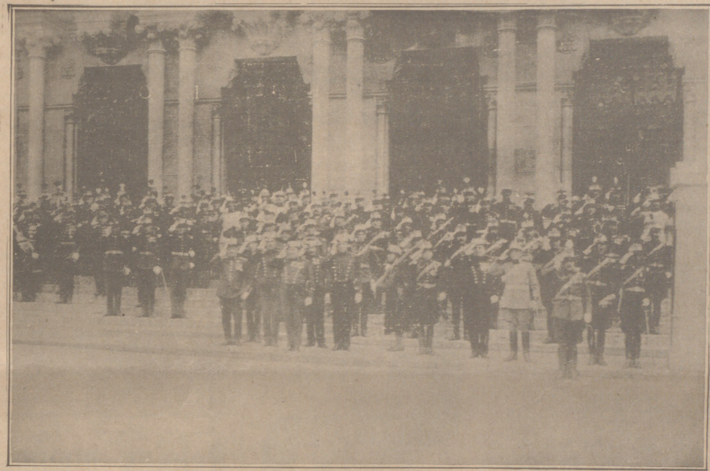
Los Jefes y Oficiales de la guarnición, en la escalinata de Capitanía, presenciando el desfile de las tropas y saludando a la bandera.