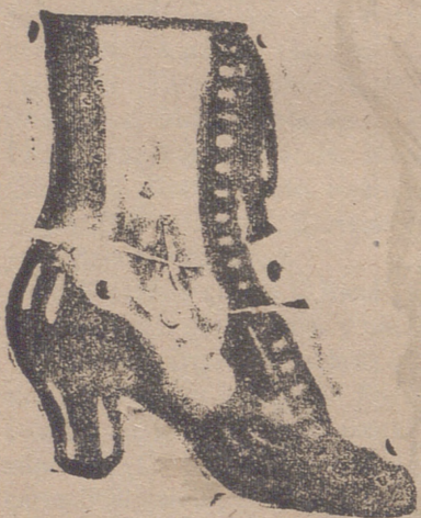
Gran surtido en todas clases, y sección económica a precios de fábrica.

Tercerillas superiores a 36, cuartas superiores a 33, comidilla a 25 y salvado de hoja a 22.