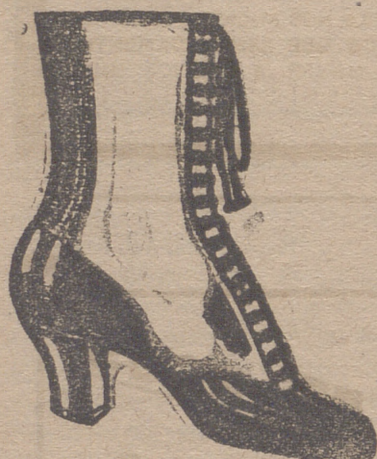
Gran surtido en todas clases, y sección económica á precios de Fábrica

DEPOSITOS: MAQUINAS DE ESCRIBIR «MOISELES» SILENCIOSA COMPLETAMENTE Sandalias «PACO». Para la temporada de invierno con piso de goma á precios muy económicos.