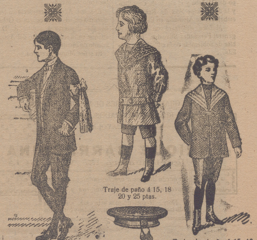
Traje de paño á 15, 18 y 25 ptas.

20 nuevos modelos en traje. Gorritas marineras en 20 ptas., los mismos en los para la Primera Comunión paño y vicuñas á 2'50, gergas azules y negras á 25, 30, 35, 40 y 50 ptas. 3, 4, 4'50 y 5 ptas. 3, 5, 30, 35 y 40 ptas.