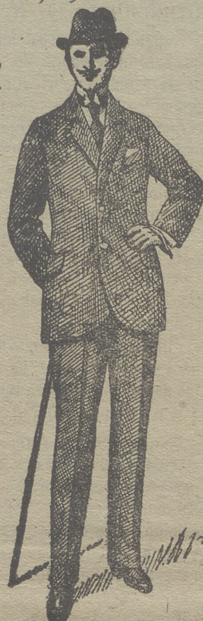
Trajes de paño de caballero y jovencito, desde 30 pesetas á 75. En pana de 25 á 60 y en dril de 20 á 35.