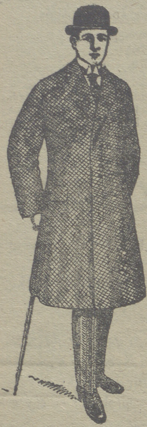
Gabanes de caballero desde 40 pesetas á 125.

PLAZA MAYOR, 42 y LAIN-CALVO, 9. Sucursal: PALOMA, 9.