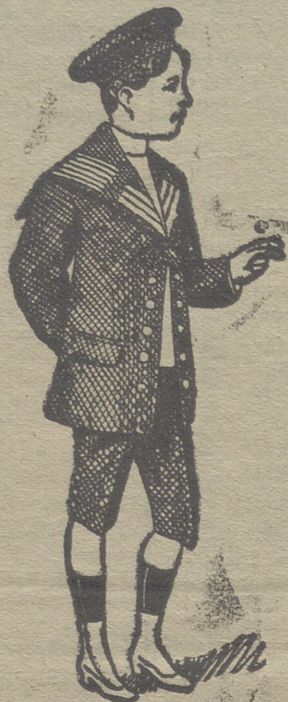
50 modelos diferentes en trajecitos de niños, en gerga, paño y pana.