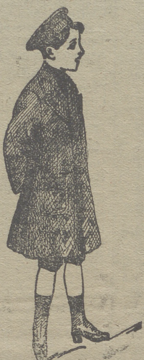
Grandes surtidos recibidos para la temporada en gabanes de jóvenes y niños.