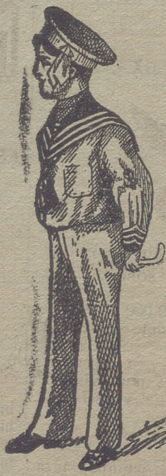
50 modelos diferentes en trajecitos de niños, en paño, vicuña, gergas y panas. Estos dos modelos son los últimos recibidos para la temporada.