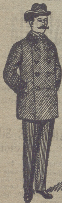
Pellicas desde 18 pese- tas á 75.