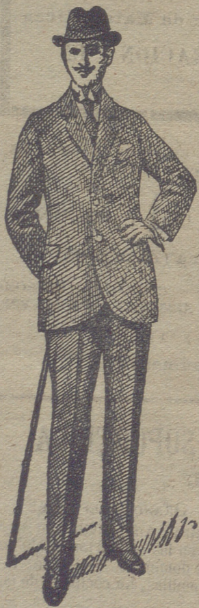
Trajes de paño de caballero y jovencito, desde 30 pese- tas á 75. En pana de 25 á 60 y en dril de 20 á 35.

Agentes depositarios: IBÁÑEZ Y COMPAÑIA, San Pabo, 6 y 8, BURGOS