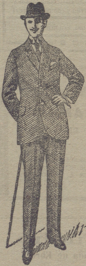
Trajes de paño de caballero y jovencito, desde 30 pesetas á 75. En pana de 25 á 60 y en dril de 20 á 35.