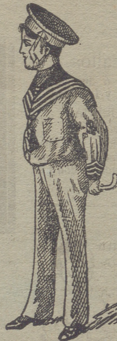
50 modelos diferentes en trajecitos de niños, en paño, vicuña, gergas y panas. Estos dos modelos son los últimos recibidos para la temporada.