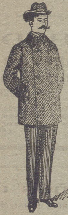
Pellizas desde 18 pesetas á 75. --- Gran surtido ---