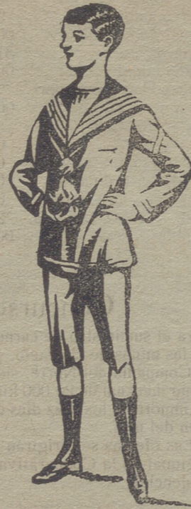
50 modelos diferentes en trajecitos de niños, de dril paño, pana, gergas, azules y negros.