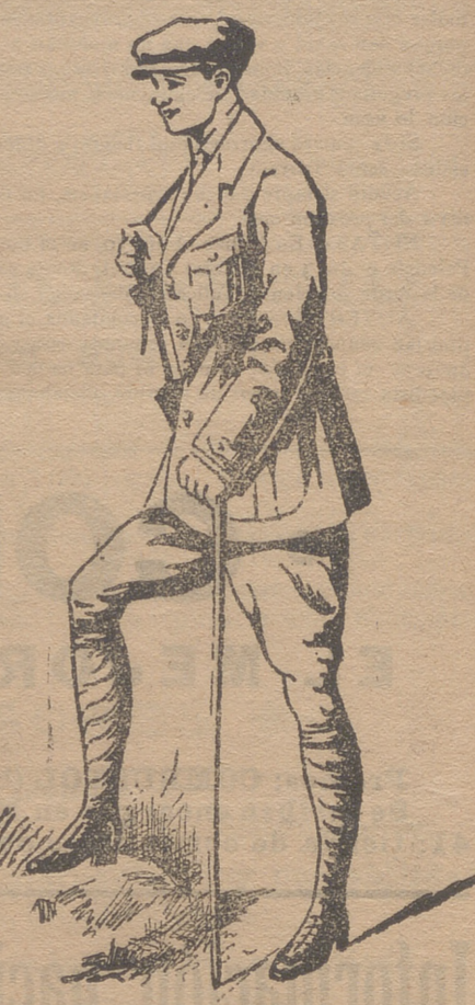
Trajes export en paño, dril y pana.

Grandes surtidos en lanería y pañería de caballero y seño.