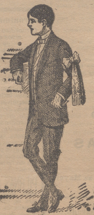
50 modelos en diferentes trajecitos de niño para primera comunión

22 modelos diferentes en abrigos de gabardina impermeabilizados. Abrigos-impermeables de señora. Capitas-impermeables de niños y niñas. Guardapolvos de caballero, señora y niño.