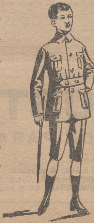
Trajecitos export y forma corriente en paño, paña y dril.

En blanco hay bonitos modelos para la Sgda. Comunión y lazos para lo mismo.