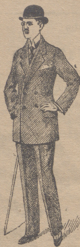
Trajes caballero de paño pana y dril

Esta casa presenta siempre grandes surtidos en trajes de caballero, joven y niños y espléndido surtido en toda clase de prendas sueltas para toda clase de trajes.