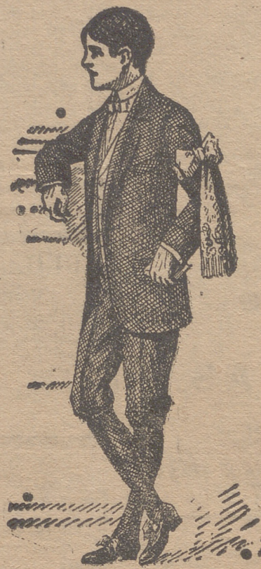
50 modelos en diferentes trajecitos de niño para primera comunión

22 modelos diferentes en abrigos de gabardina impermeabilizados. Abrigos impermeables de señora. Capitas impermeables de niños y niñas. Guardapolvos de caballero, señora y niño.