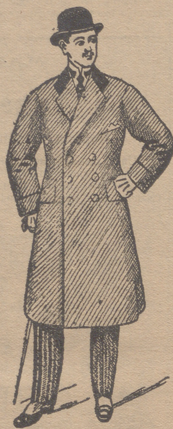
Abrigos gabardina desde 80 ptas. á 150 ptas.

Esta casa presenta siempre grandes surtidos en trajes de caballero, joven y niños y espléndido surtido en toda clase de prendas sueltas para toda clase de trajes.