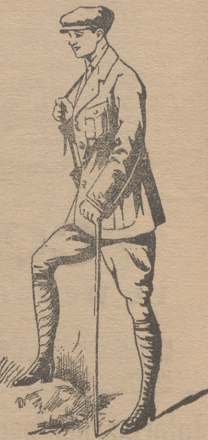
Trajes export en paño, dril y pana.

Ropa blanca de señora y niñas. Camisería, corbatería, tirantes y ligas. Grandes surtidos en lanería y pañería de caballero y seño