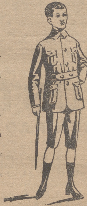
Trajecitos export y forma corriente en paño, paña y dril.

En blanco hay bonitos modelos para la Sgda. Comunión y lazos para lo mismo.