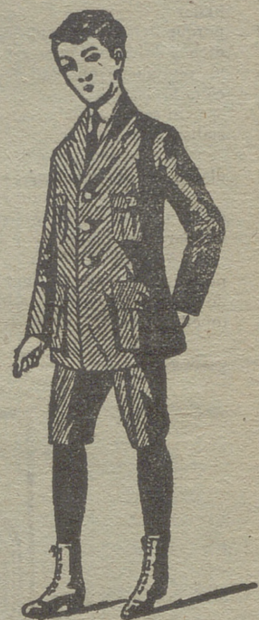
Trajes de jovencitos forma export y corriente en paño, pana y dril.

Rópa blanca de señora y niños, corsés, medias en gasa, seda hilo y algodón, toquillas pelerinas en pelo cabra y lana. Lanería y pañería para señora, paños patentes y panas para caballero