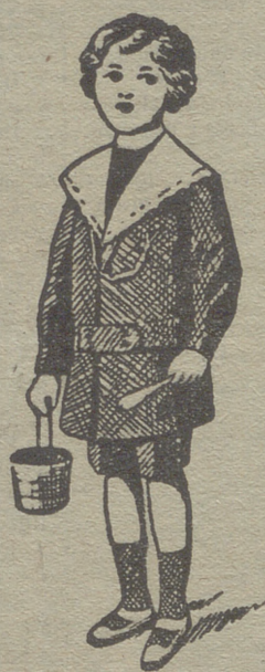
50 modelos diferentes en trajecitos de niños en paño gerga y pana.

Ultimos modelos en gabanes de caballero, jóvenes y niños :- Trajes de caballero en paño y pana :- Trajes export de paño y pana, y trajes completos azules para mecánicos y motoristas.