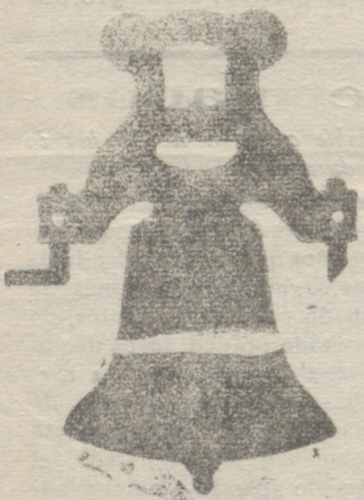
Conseja con yugo de hierro de una sola pieza

Calle de Francia y Portal de Urbina VITORIA (ALAVA)