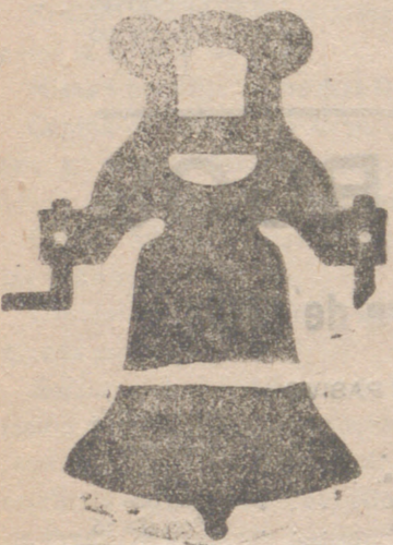
Campana con yugo de hierro de esta casa.

Calle de Francia y Portal de Urbina VITORIA (ALAVA)