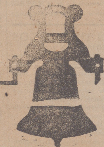
Campana con yugo de hierro de una sola pieza

Gran diploma de honor y medalla de oro en la Exposición Hispano-Francesa de Zaragoza en 1908 Calle de Francia y Portal de Urbina VITORIA (ALAVA)