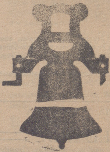
Campana con yugo de hierro de una sola pieza

Calle de Francia y Portal de Urbión VITORIA (ALAVA)