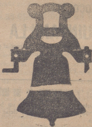
Campana con yugo de hierro de una sola pieza

Tenemos el gusto de expresar á continuación algunas de las obras realizadas en estos últimos años en Burgos y su provincia, á fin de que los que los interesen conocer esta clase de trabajos, puedan ver palpablemente la superioridad de los productos de esta casa