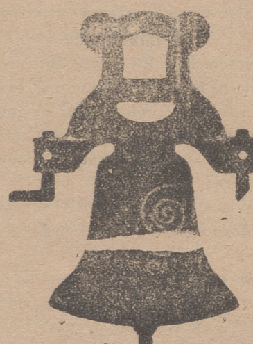
Campana con yugo de hierro de una sola pieza

Calle de Francia y Portal de Urbina VITORIA (ALAVA)