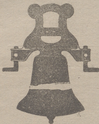
Campana con yugo de hierro de una sola pieza

Gran diploma de honor y medalla de oro en la Exposición Hispano-Francesa de Zaragoza en 1908 Calle de Francia y Portal de Urbina VITORIA (ALAVA)