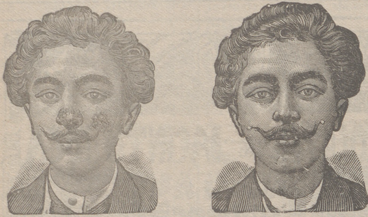
Antes de la curación Después de 15 días de tratamiento

Curación de las enfermedades de la piel y también de las llagas de las piernas LA SANGRE