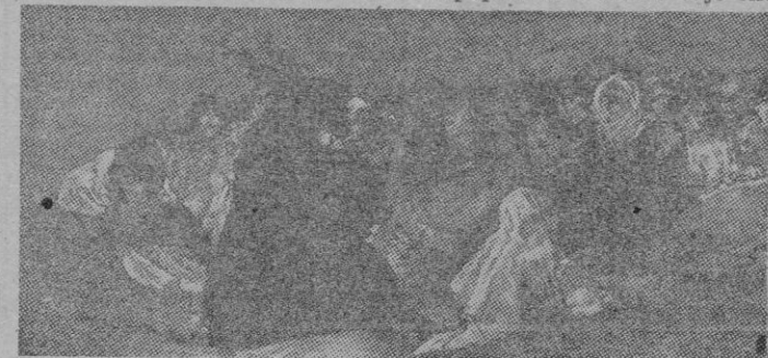
Una de las «pinturas negras» de Goya.

retrata: físicamente sólido atlético y achaparrado y muscularmente bien dotado, destacada su gran cabeza, con su cabello espejo negro y enmarañado del que algunos mechones se amontonan tras unas orejas que ya no oyen, o caen sobre la vasta farente horizontalmente plegada en gesto de forzada atención del que no oye; los ojos, bajo unas cejas espesas, poderosas y sinofrídicas, subrayados por profundas ojeras y párpados abotargados que denotan el insomnio y la angustia, son tristes, activos, curiosos, intensos, pero dirigidos dentro de sí, con sus pupilas asimétricas bajo ellos