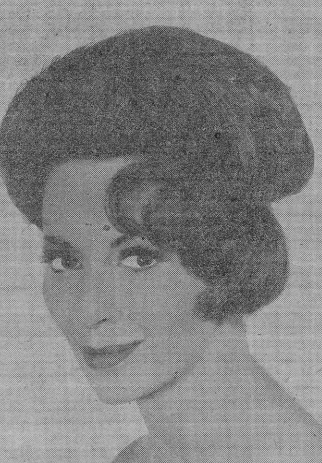
Peinado «Ondine»: anchos movimientos ondulados enmarcan suavemente el rostro, volviendo sobre la frente y las mejillas. Ojos ampliamente enmarcados, labios perfilados con un nuevo rosa natural.

Alexandre propone para sus peinados «Ondine» un vals de la época.