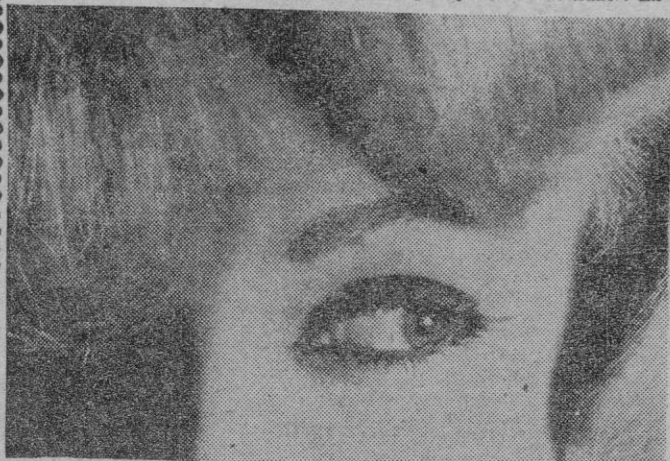
Toda la audacia y el encanto del maquillaje «Fleur de Lune» residen en su «Ojo de Sirena».

Es en el «ojo de Sirena», con sus tonos grises rebajados, donde reside todo el encanto y el refinamiento del maquillaje «Fleur de Lune». En