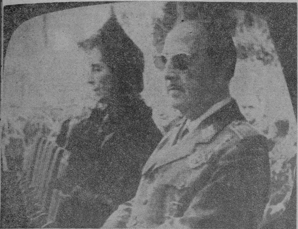
SS. EE. el Jefe del Estado y su esposa, en la presidencia de la Misa, celebrada en El Pardo, con motivo de su onomástica.

MADRID, 4. — Con motivo de la festividad de San Francisco de Asís, onomástica de S. E. el Jefe del Estado, se ha celebrado esta mañana en El Pardo, en el cuartel del Regimiento de la Guardia de S. E., una solemne misa de campaña oficiada por el capellán de dicho regimiento, don Fermín Zamorano, quien pronunció una elocuente plática.