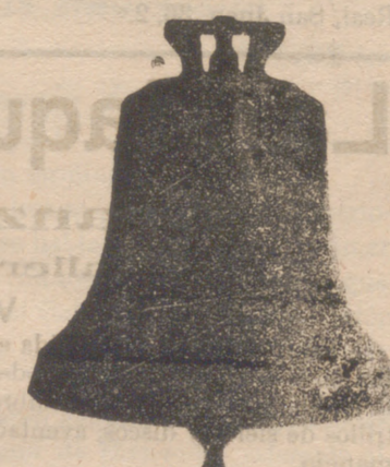
Todas mis campanas suenan la NOTA justa convenida construcción esmeradísima ya garantía 10 años.

Única fábrica de su género en España, dotada de maquinaria de gran precisión y motores á vapor y eléctricos; se construyen relojes para iglesias, Casa consistoriales, colegios, cuarteles, etc., etc.