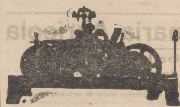
Reloj de ocho días de cuerda tocando heras con repetición y medias