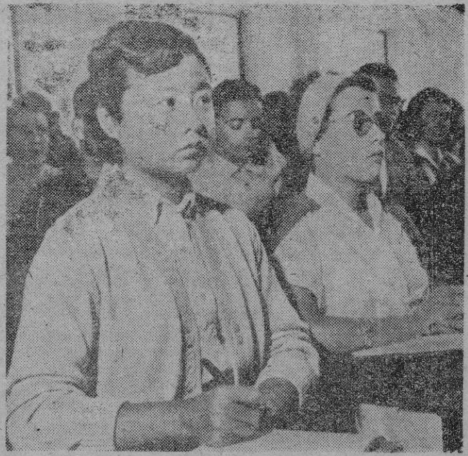
Rostros en el Curso para extranjeros de la Universidad de la Magdalena, de Santander. En primer plano, dos guapas muchachas, asistentes, una de ellas es una encantadora estudiante oriental.