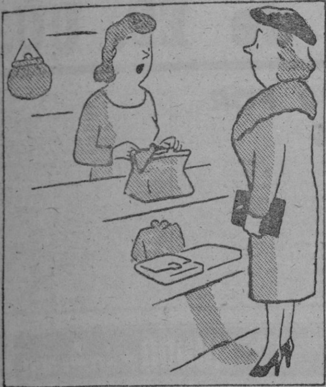
—Además, contiene un compartimento secreto para esconder la cartera del marido.