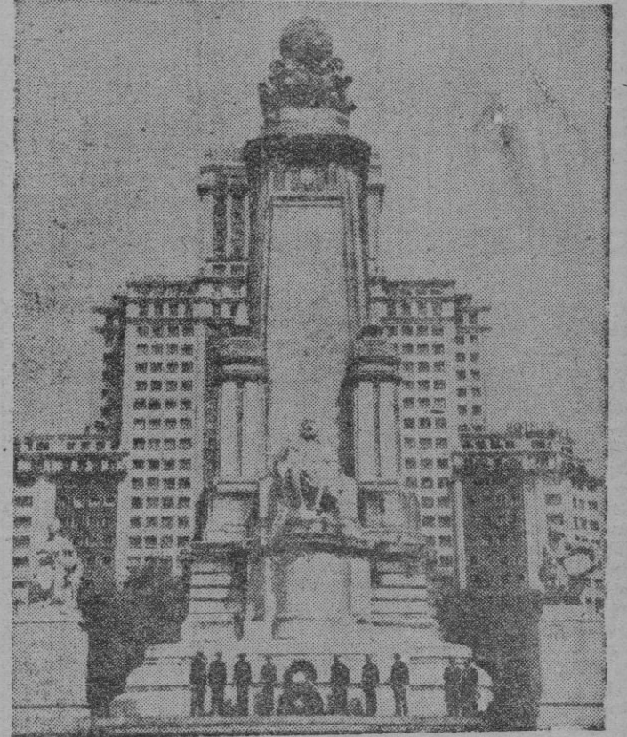
Madrid. — Entre los actos conmemorativos de la muerte de Miguel de Cervantes, figuró la ceremonia de colocación de dos monumentales coronas de laurel al pie del monumento al autor del «Quijote» por el Ayuntamiento de la Villa y la Sociedad Cervantina. Presidieron el acto el Presidente de la Diputación madrileña y el Alcalde, Conde de Mayalde, asistiendo al mismo destacadas personalidades de las letras españolas.

perspectivas? Se envían más obras cada día. La presentación influye, el prestigio de algunos escritores es también factor decisivo. No cabe duda que el Estado español ha dedicado atención al problema del libro. El papel de