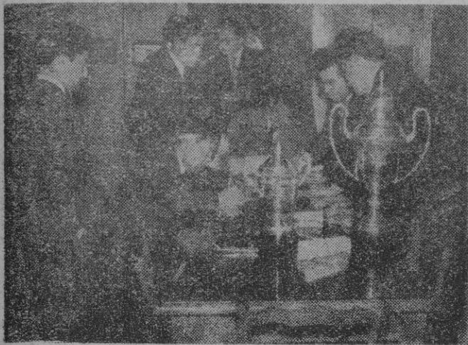
Los Delegados de equipo, en los locales de la Asociación de la Prensa, ultimando detalles sobre la competición que se inicia hoy.

Bajo la presidencia del Ministro Secretario General del Movimiento y Jerarquías Sindicales