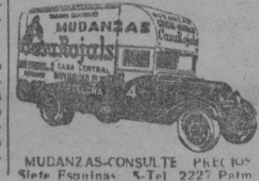
MUDANZAS-CONSULTE PRECIOS Siete Esquinas 5-Tel 2227 Palm