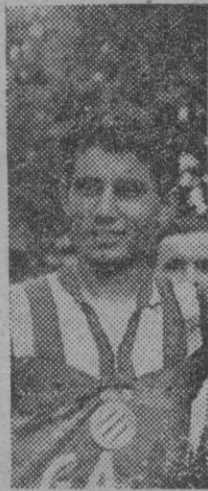
SEGU Campeón de Barcelona de fondo en carretera.

Otra victoria, pues, para "Ignis" en carrera de una jornada. Poblet y Bahamontes exhibieron algún destello de su clase, pero muy poco. La iniciativa, una vez más, corrió a cargo de los modestos.