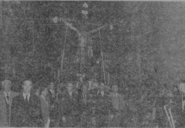
La venerada imagen del Cristo de Santa Cruz, llevada ayer en la procesión del mismo nombre

Lea en «Lealtad»: Pintura. 1958; Alain Combar, naufrago voluntario; y otros interesantes reportajes.