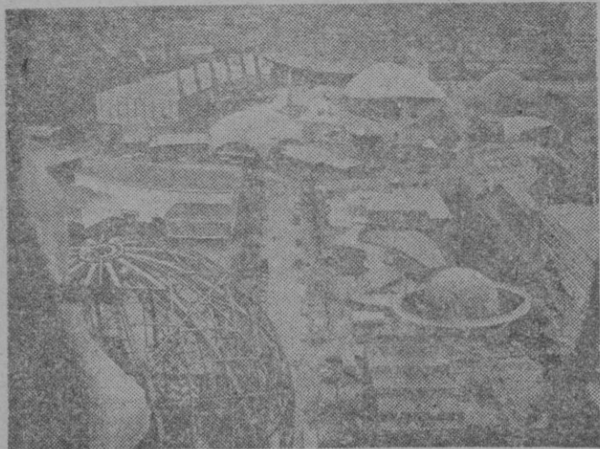
Un aspecto de lo avanzados que se llevan los trabajos de instalación de los diversos pabellones, en los cuales estarán representados todos los países del mundo.

Un viaje de «Baleares» en colaboración con la «Cía. Hispanoamericana de Turismo»