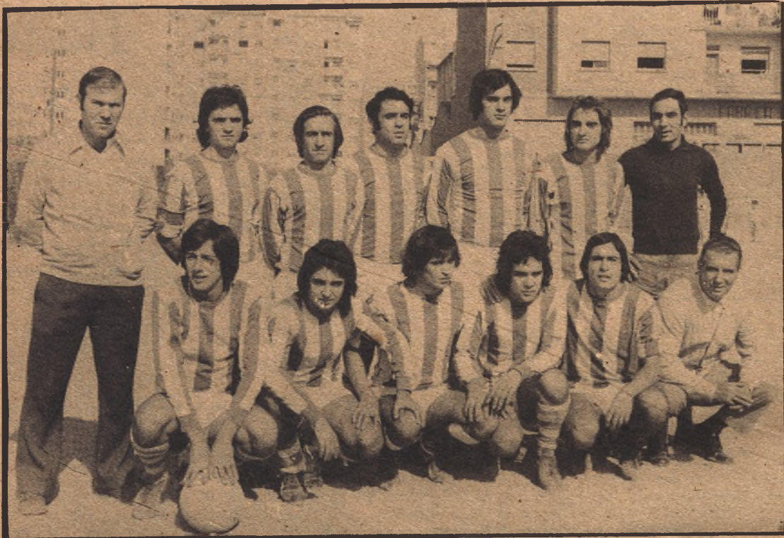
EJEMPLO DE AFICION: LOS JUGADORES QUERIAN PAGAR EL DESPLAZAMIENTO A BERLANGA DE DUERO

Se fundó por el año 1968, y está enclavado en el Barrio zaragozano Delicias, sector del nombre que ostentan.