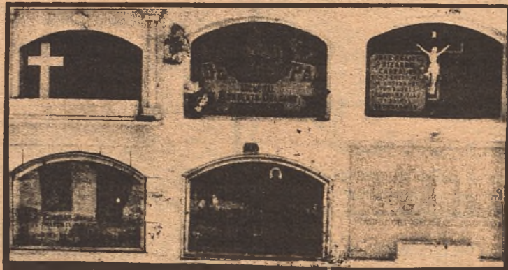
Arriba, en el centro, el nicho donde descansan los restos mortales de Humberto Delgado, en el cementerio de Villanueva del Fresno (Badajoz).

VISITA DE INSPECCION AL CEMENTERIO DE VILLANUEVA DEL FRESNO