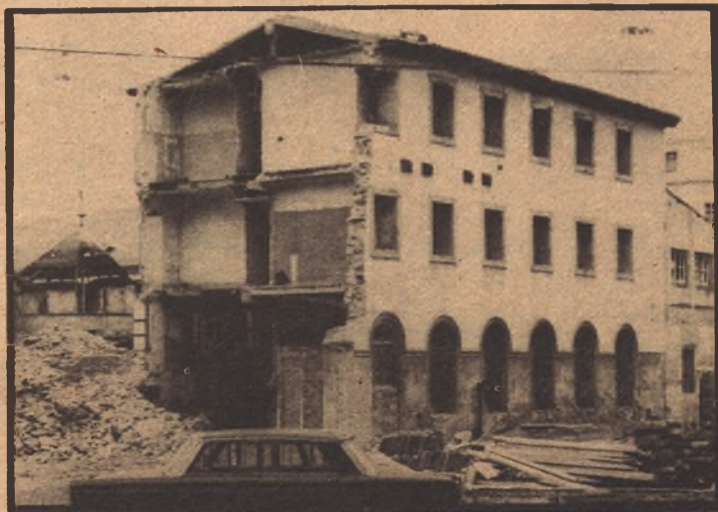
Y ahí están los escombros que no se sabe quién debe retirarlos, pero fácil es deducir quién apachugará al final con los tochos rotos...

Dar órdenes rigurosísimas a los correspondientes empleados municipales (si los hay), para que sigan permitiendo el "streaking" a los perros bohemios que llenan nuestras calles, para de esta forma crear ambiente en Calatayud de ciudad libre-vividora con las bolsas de basura abiertas a cualquier perro con auténtico espíritu liberatorio, progresivo e independiente como hay en este