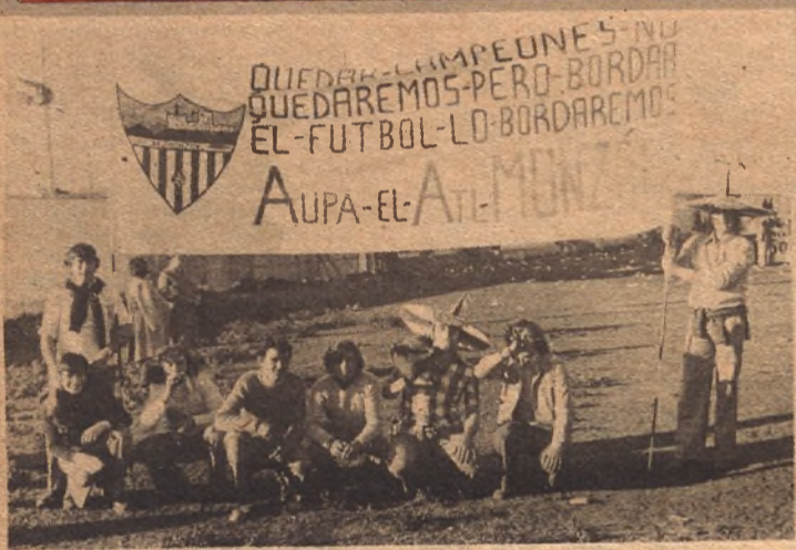
-No fué fácil el camino del Huesca en esta Liga. En todos los campos se le recibió "con todas las de la ley" y todos los equipos se superaron ante el líder. Sin embargo, los azulgrana con entusiasmo y tenacidad superaron todas las dificultades deportivas y de ambiente. En la foto, una de las muchas pancartas que alegraban el campo del Monzón el día que jugó el Huesca en aquella localidad.

Con la victoria del Aragón sobre el Fraga, el pasado martes, queda también sentenciado el subcampeonato. Así pues, el filial zaragozista será quien juegue la promoción de ascenso a Tercera.