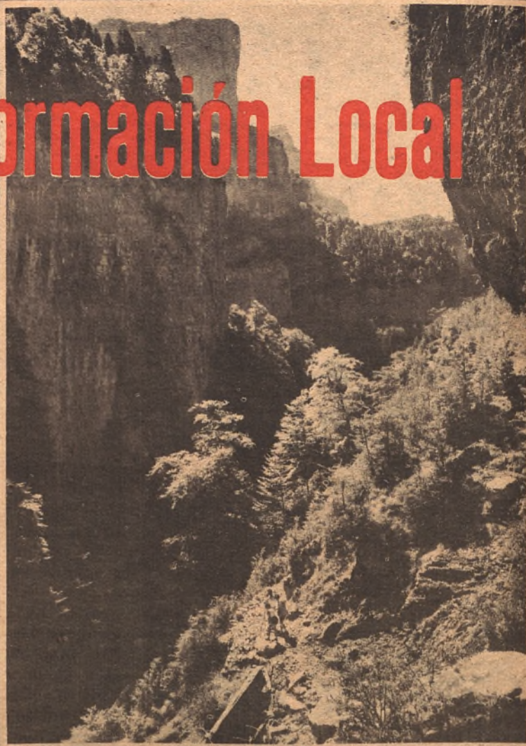
Estupenda perspectiva del valle de Añisclo que todavía conserva su impresionante belleza original. Amenazado por la industria eléctrica, todo Aragón ha salido en su defensa a través de los distintos medios de información, pero ¿quién creen ustedes que ganará la partida finalmente?

Organizado por la Asociación Cultural Hikari y patrocinado por el Excmo. Ayuntamiento, el próximo viernes día 17 a las 8 de la tarde, en el Hogar Cultural Genaro Poza, disertará don Javier García Berlanga, matemático, sobre el tema: "Desarrollo Regional".