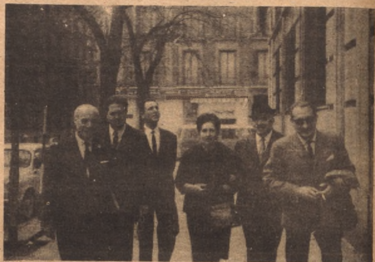
Mario Soares (segundo de la izquierda) en la madrileña plaza de la Villa de París, con los familiares de Humberto Delgado (mayo de 1965). La fotografía, inédita hasta ahora, ha sido recogida por el diario "Hoy" de Badajoz.

Soares acompañó a la familia de Humberto Delgado en sus visitas a Badajoz y a Madrid durante aquellos días de mayo de 1965, una vez conocida la muerte del líder de la oposición portuguesa. Un documento gráfico que ha sido dado a conocer