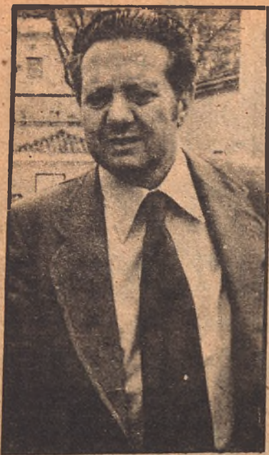
Mario Soares ante el Palacio presidencial de Belém (mayo de 1974)