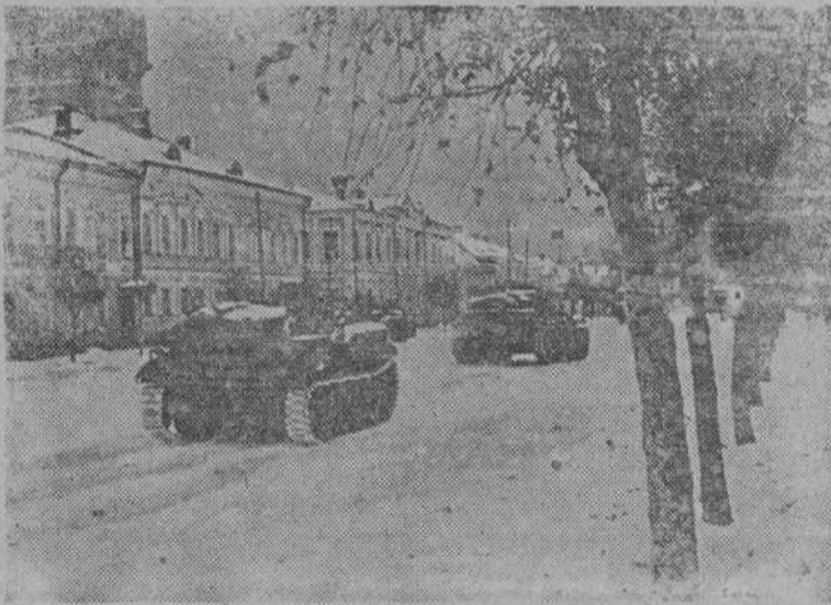
Tanques alemanes pasan por una calle de Kalinin, recientemente conquistada.

Berlín, 2.—En los centros competentes de la capital alemana se muestra gran reserva en cuanto se refiere a la entrevista entre Petain y Goering. Se estima prematura cualquier posición relativa a este asunto.—(Efe).